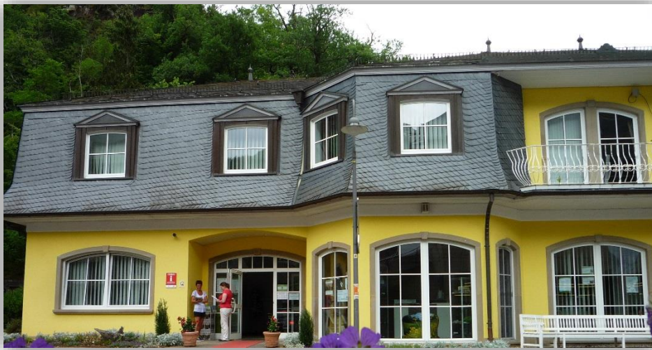
Tourist Information Bad Bertrich