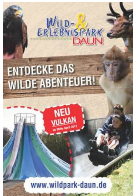
Wild- und Erlebnispark Daun