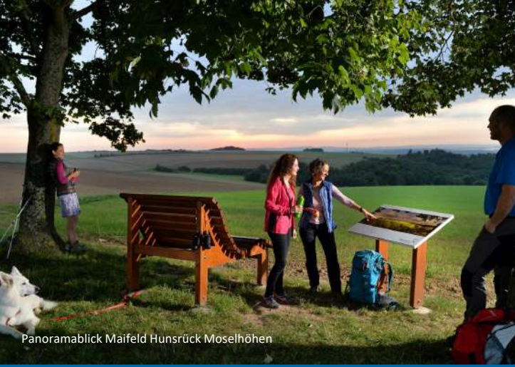
Panoramablick Maifeld Hunsrück Moselhöhen

Der Wanderweg verbindet mehrere Orte im Schieferland Kaisersesch miteinander und hält spektakuläre Ausblicke sowie naturbelassene Pfade für Sie bereit. Ein weiteres Highlight der Wanderroute ist die Kulm – ein von weiten Feldern umgebener Aussichtspunkt (409 m). Der Blick reicht bei klarem Wetter bis in den Hunsrück. Beeindruckend ist auch der Weitblick ins Maifeld, vor allem wenn der Raps blüht. In Gamlen bietet der Brodhübel eine ideale Möglichkeit, um eine Rast mit einem kleinen Picknick einzulegen. Eine weitere Attraktion auf der „Route Pyrmont“ ist die XXL-Bank in Mönthenich. Fühlen Sie sich für einen kurzen Augenblick ganz groß und erleben Sie einen wunderschönen Weitblick ins Maifeld. Nehmen Sie Platz und lassen Sie die Beine baumeln.